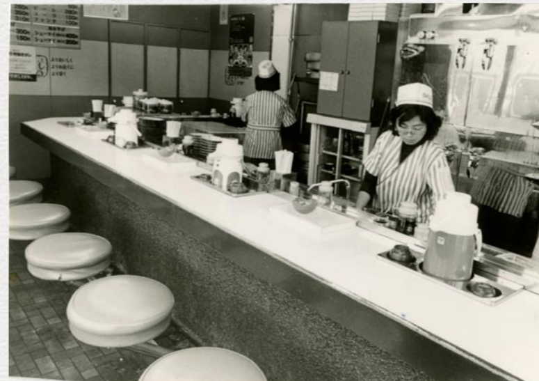
「安く!早く!おいしい!」の三拍子揃った「みよしの」は昭和42年に産声を上げた。(写真は昭和50年代)

ある時、東京から遊びに来た友人に「ホテルに戻ってから食べて」と渡したら驚いていた。こんなに旨い餃子が東京にあったらいいのに、と。私は嬉しくて、以来、道外から遊びに来る友人たちに「おみやげぎょうざ」を渡すことが定番になった。