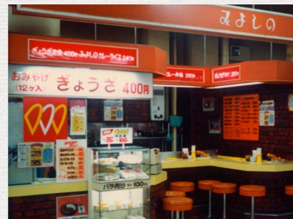
昭和61年、スーパー内のテナント店。ファストフード感覚で餃子を味わうスタイルはたちまち人気に。